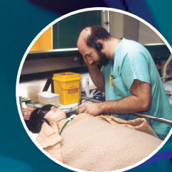
Sala de recuperación