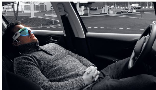
Récupération sur aire de repos

Naturellement vous pouvez utiliser le PSiO chaque fois que le besoin de détente ou de récupération se fait sentir.