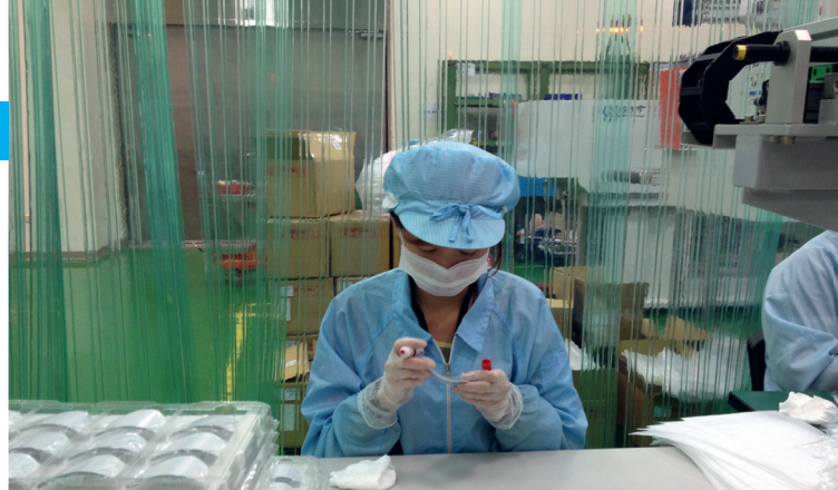
Fabrication en laboratoires de hautes technologies